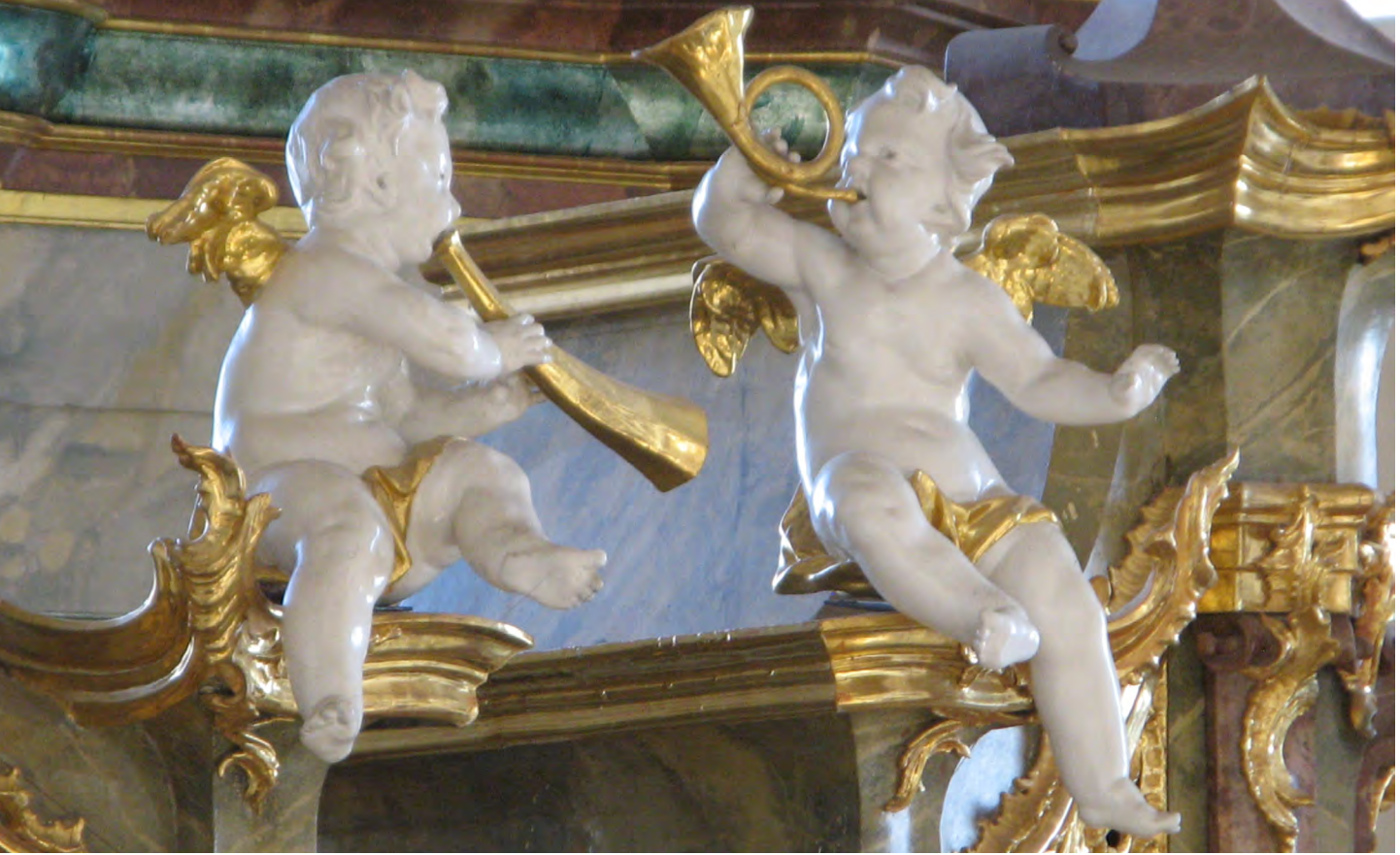
Ausschnitt des Orgelschmucks in der Pfarrkirche St. Peter im Hochschwarzwald.

Ein Freund ist jemand, der die Melodie deines Herzens kennt und sie dir vorspielt, wenn du sie vergessen hast.