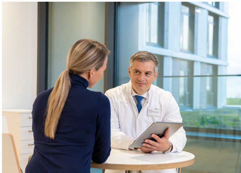
Ärztliche Patientenberatung in hellem und freundlichem Ambiente.

Die Fertigstellung des Neubaus in der Steinhäuserstraße bildet zugleich den Auftakt für die neue Kampagne „Bestens versorgt“ der ViDia Kliniken. Im Fokus der Kampagne steht das gesamte Leistungsspektrum der ViDia Kliniken an allen vier Standorten. Ziel ist es, Patienten, Besucher, zuweisende Ärzte in der Region und Interessierte über bestehende und neue Angebote zu informieren. Dabei reicht das Portfolio von einer umfassenden Broschüre über Anzeigen und einen Webauftritt bis hin zu digitalen Führungen, die über die Website der ViDia Kliniken abrufbar sein werden.