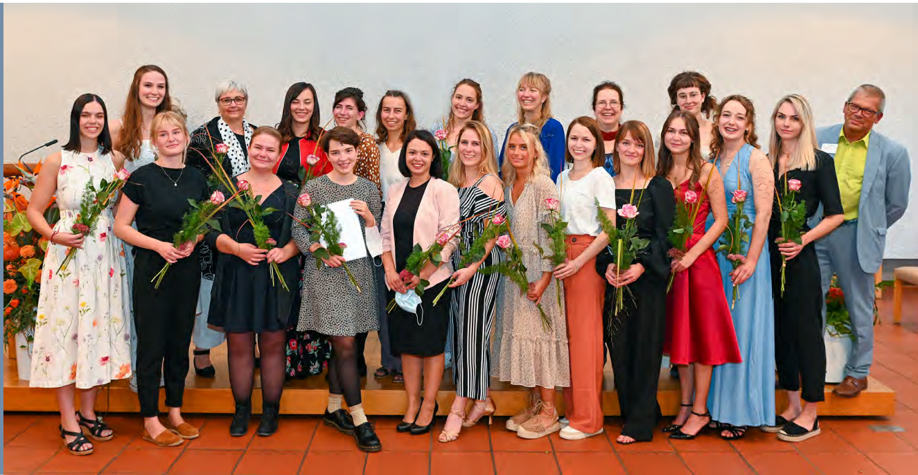
Die jüngsten Absolventinnen der klassischen Ausbildung an der Hebammschule Karlsruhe und den ViDia Kliniken für Gynäkologie und Geburtshilfe erhielten im September 2021 ihre Abschlusszeugnisse.