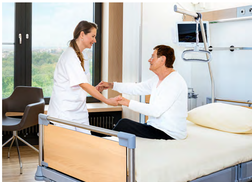
Patientenzimmer mit hochwertiger Ausstattung und Blick ins Grüne