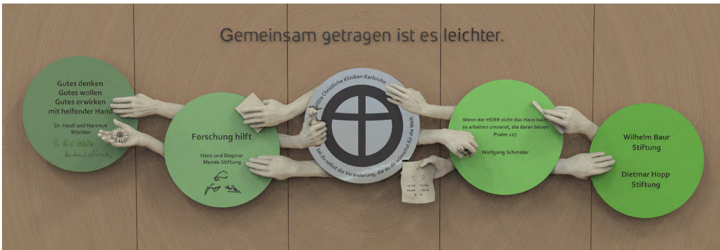
Rendering der im 3-D-Druck erstellten Ehrungssymbolik in Zusammenarbeit mit der Majolika Karlsruhe.