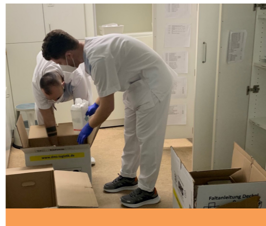
Auch beim Packen für den Umzug auf Station halfen die Auszubildenden fleißig mit.