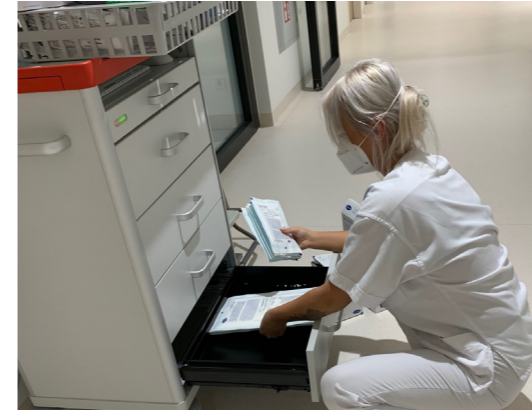
Eine wertvolle Hilfe waren die Auszubildenden auch bei den Umzugsvorbereitungen der stationären Teams.