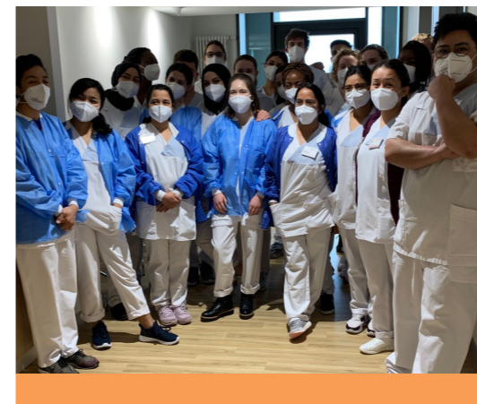
Bereit für ein nicht alltägliches Projekt: Auszubildende der Berta-Renner-Schule unterstützen als Lotsen den Umzug von Patienten in den Neubau Steinhäuserstraße.