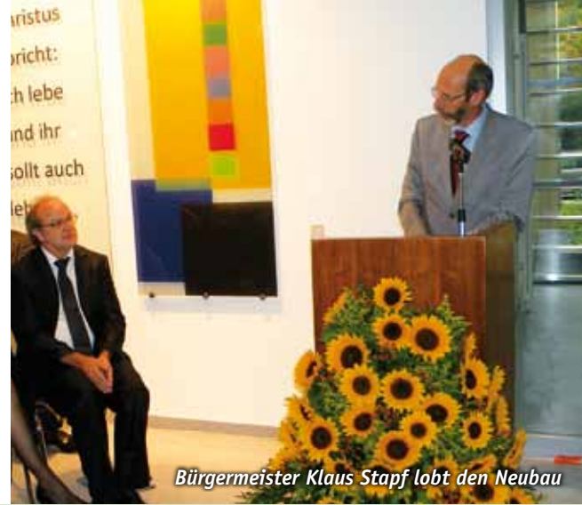
Bürgermeister Klaus Stappf lobt den Neubau