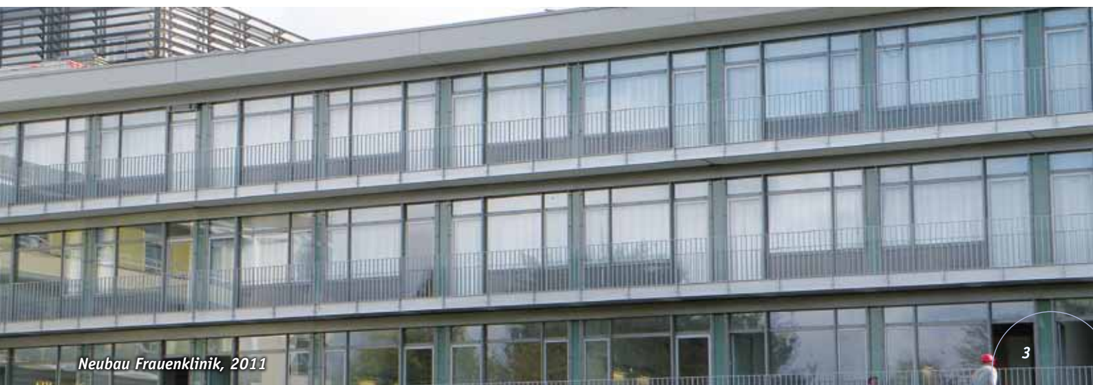
Neubau Frauenklinik, 2011

In den 80er und 90er Jahren kamen noch eine neue Augenklinik und eine Erweiterung der Hals-Nasen-Ohren-Klinik hinzu. Der letzte große Anbau wurde 2004 eingeweiht. Der so genannte Zentralbau stellt eine Aufstockung um 5 Etagen des bisherigen eingeschossigen Verbindungsbaus von Frauenklinik und Sanitärbaubau dar. Im Jahr 1984 erfolgte eine Totalrenovierung der Frauenklinik. 20 Jahre später gab es neue Umbaupläne, die aus Gründen der Wirtschaftlichkeit verworfen wurden. Der enge Schottenbau von 1964 erwies sich inzwischen als völlig unflexibel für einen Umbau. So entschied man sich für einen Antrag beim Sozialministerium für einen Erweiterungsneubau.