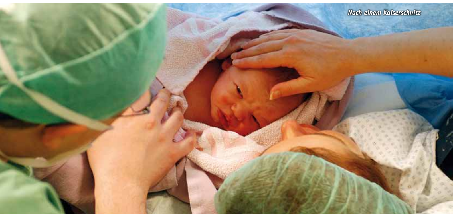
Nach einem Kaiserschnitt

ich als Leiter der Frauenklinik folgendes sagen: Ohne unsere „Arbeits-Familie“ aus der Frauenklinik, aber auch alle aus der Inneren Medizin und aus der Apotheke wäre dieser Bau nicht so zügig zu realisieren gewesen. Als Chefarzt weiß ich sehr wohl die Baulärm-Toleranz, das Improvisationstalent und die guten Ideen aller bei der Bewältigung so mancher durch den Bau ausgelösten Krise zu schätzen. Bisweilen hatte man das Gefühl, vor lauter Bau-Stress möglicherweise verrückt zu werden. So ein Hausbau ist immer nervenaufreibend, stellenweise hätte man in die Luft gehen können. Doch durch gemeinsame Anstrengungen, durch ein ungebrochenes Talent zur Improvisation sowie durch eine tatkräftige Solidarität wurde dafür gesorgt, dass trotz aller Bau-Probleme nie der Boden unter den Füßen verloren ging – wenn er auch gelegentlich schon arg bebte! Alle haben Durchhaltevermögen und Geduld bewiesen, das ist nicht selbstverständlich. Als Drittes möchte ich noch ein persönliches Wort aus meiner Erfahrung als Erbauer eines eigenen „Häusles“ und zugleich als Vater einer großen Familie ausführen: Ein neues Haus