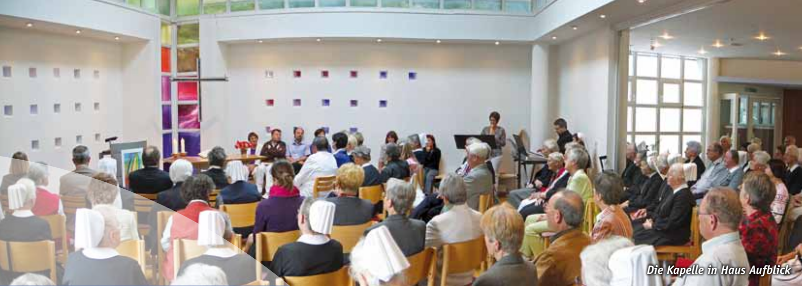
Die Kapelle in Haus Aufblick