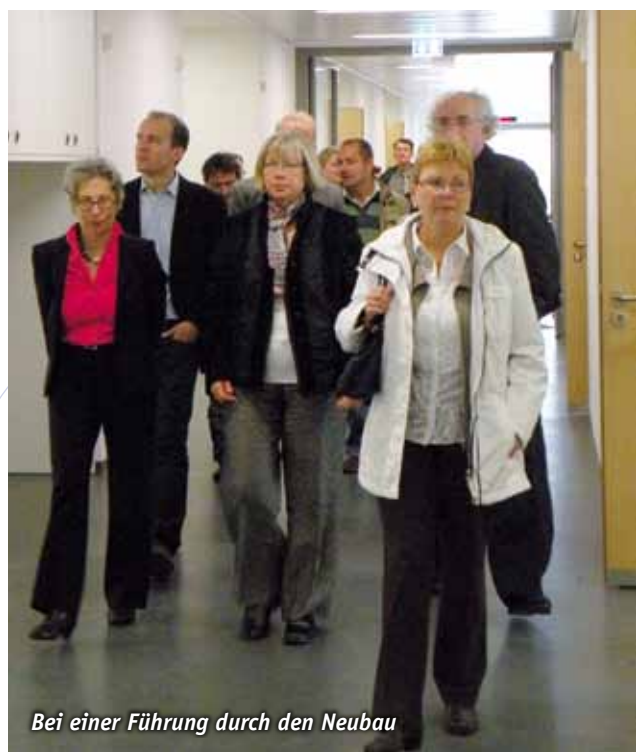
Bei einer Führung durch den Neubau