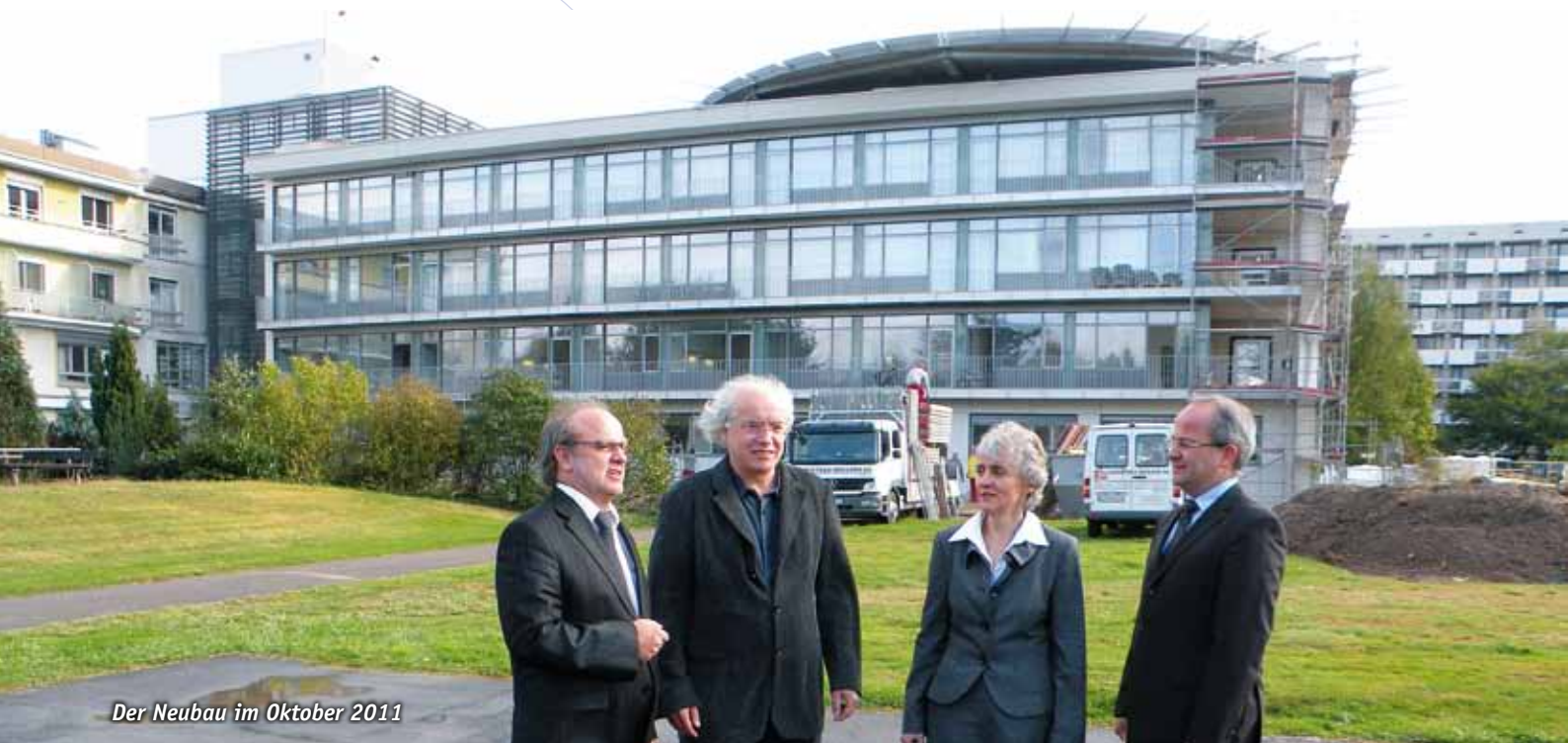
Der Neubau im Oktober 2011