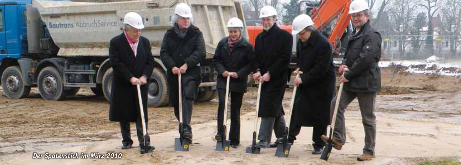
Der Spatenstich im März 2010