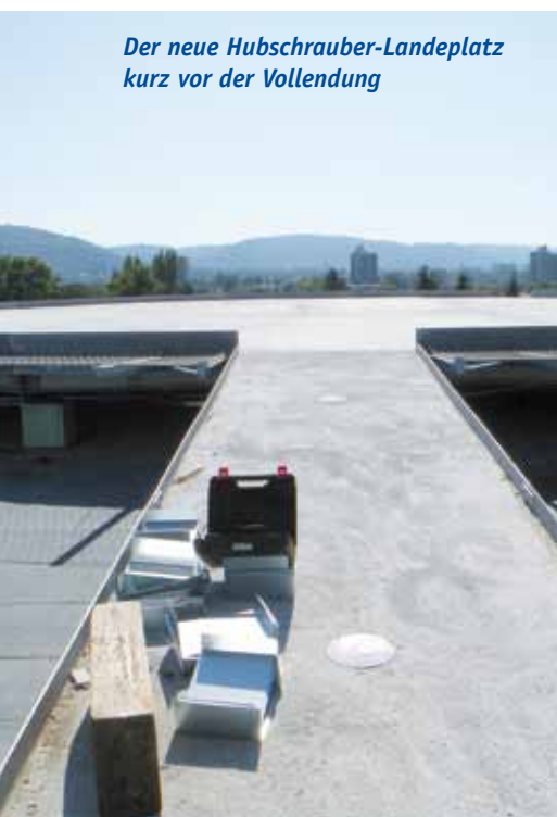
Der neue Hubschrauber-Landeplatz kurz vor der Vollendung

in den Obergeschossen ersetzen die Stationen in der alten Frauenklinik, die nachweislich nicht mehr so saniert werden konnten, dass sie den heutigen geforderten Standards entsprechen. Die neuen Zimmer sind alle mit behindertenfreundlichen Nasszellen ausgestattet, die 1-Bett- und die 2-Bettzimmer haben – wie fast alle Zimmer des Krankenhauses – einen Balkon mit weitem Blick ins Grüne. Dies ist auch eines der Alleinstellungsmerkmale des Diakonissenkrankenhauses gegenüber anderen Kliniken in der Region. Auf dem Dach befindet sich das technische Highlight: Der neue Hubschrauberlandeplatz, der eine direkte Anbindung der Krankentransporte an den Schockraum im Haus gewährleistet und somit die gesetzlichen Forderungen erfüllt sowie den europäischen Standards entspricht. – Am Ende seiner Ansprache betonte der Architekt, dass solch ein komplexes Projekt mit fünf Funktionsbereichen nur mit gegenseitigem Respekt und Vertrauen in so kurzer Zeit zu realisieren ist. Von daher ist er allen Beteiligten sehr dankbar, dass sie ihre Ideen und ihre Erfahrung in diese Planung mit eingebracht und somit zum Gelingen dieser Baumaßnahme beigetragen haben.